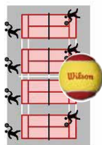
1/4 コート (11mサイズ)